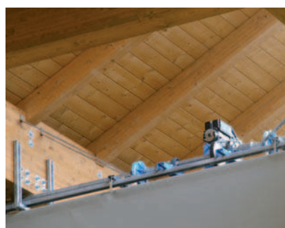
Dettagli del sistema meccanico Details of mechanical system